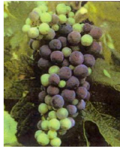
M2: Pleno envero

El momento óptimo (de media en Ribera del Duero para los últimos quince años) en que habría de ser realizada esta labor de aclareo de racimos se sitúa en torno al 12 de agosto . Teniendo en cuenta todo lo anterior, así como que la cosecha a día de hoy se encuentra en cuanto a su ciclo en las fechas históricas habituales, es razonable conceder un período máximo de unas tres semanas tras esa fecha para la realización del aclareo de racimos, por lo que el Pleno, en su reunión ordinaria de Consejo celebrada el día 23 de Julio de 2021, ha establecido que dicha práctica debe realizarse antes del domingo 5 (*) de septiembre de 2021 .